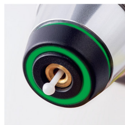
iCare イージーポジショニング