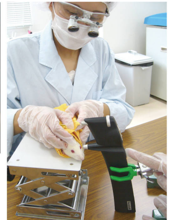
現場ではこのように固定台を用いて測定しています。