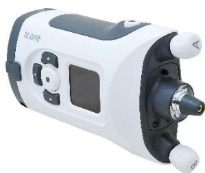
1) アイケア HOME 2 本体