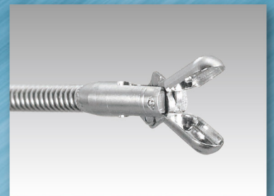
生検鉗子「セルメンSE1.5」

ハンドル部のストッパー機能が先端部開閉時にかかる過度のストレスを抑えるため、壊れにくい構造です。