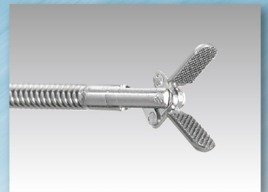
把持鉗子「セルメンHK1.2」